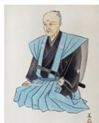
写真: 井戸平左衛門公肖像 (井戸神社所蔵) 協力: 大田市文化協会

8:30~18:00【オリエンテーション室】 大田市文化協会が作成した 第19代大森代官 井戸平左衛門正明公 「大田市内の頌徳碑総覧」の一部をポスターで紹介。