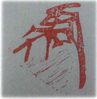
吉川元春花押（消しゴムはんこ製）